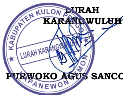
PURWOKO AGUS SANCOYO